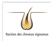
Racines des cheveux vigoureux

Complément alimentaire à l'extrait de graines de Fenugrec, vitamines et oligo-éléments. Un mode de vie sain est important, tout comme une alimentation variée et équilibrée, à laquelle les compléments alimentaires ne sauraient se substituer.