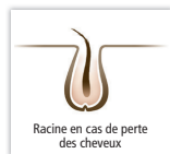
Racine en cas de perte des cheveux